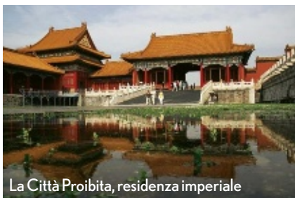
La Città Proibita, residenza imperiale