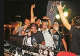
Il Mojotic Festival

La serata più pazzca sarà quella della Silent Disco, il 5 agosto, ma al Mojotic Festival di Sestri Levante, una delle rassegne musicali più divertenti dell’estate, la festa andrà avanti fino al 2 settembre con band internazionali e un finale tutto italiano con i genovesi Ex-Otago, Iosonouncane e Francesco Motta. Dormire B&b La pergola dei paggi, da € 40 a persona. Lapergoladeipaggi.com B&b Piazza Italia doppie da € 90. Bbpiazzaitalia.it