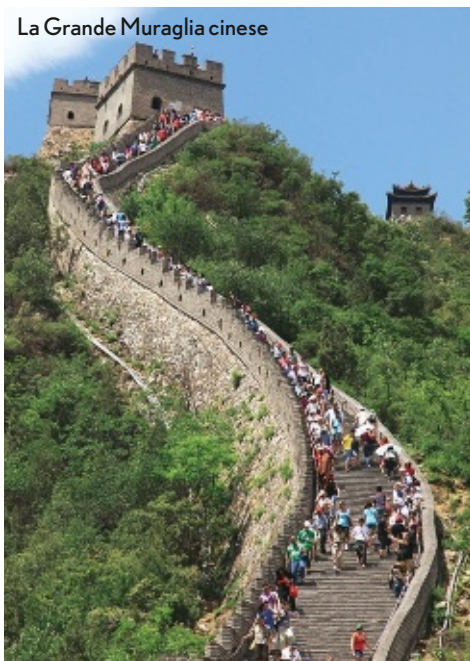
La Grande Muraglia cinese