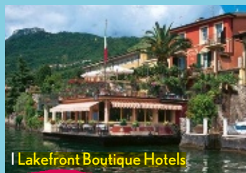
Il Lakefront Boutique Hotels

U n viaggio breve, ma intensissimo, per scoprire la capitale del Celeste Impero, tra palazzi imperiali e grattacieli avveniristici. Dal 17 agosto al 28 ottobre, il tour operator Goasia propone il pacchetto Tutti a Pechino , una “toccata e fuga” in Cina per visitare la Città Proibita e Piazza Tian’anmen e partecipare a un’escursione alla Grande Muraglia. Nel tempo libero ti aspettano angoli suggestivi come la Via degli Antiquari, lo shopping al mall The Place e i locali trendy, come il Bar Atmosphere dell’Hotel Shangri-La, all’ottantesimo piano del China World Summit Wing. Il viaggio di 6 giorni/4 notti, con voli a/r, trasferimenti e visto parte da € 1155 a persona. Goasia.it