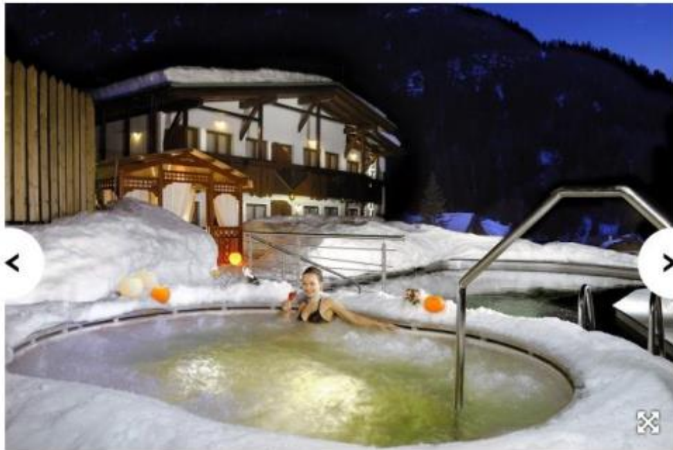
Una calda e comoda vasca idromassaggio immersi nei panorami mozzafiato del Parco Nazionale dello Stelvio: un sogno che diventa realtà al Kristiania Pure Nature Hotel & Spa di Cogolo di Pejo, in Trentino. www.hotelkristiania.it