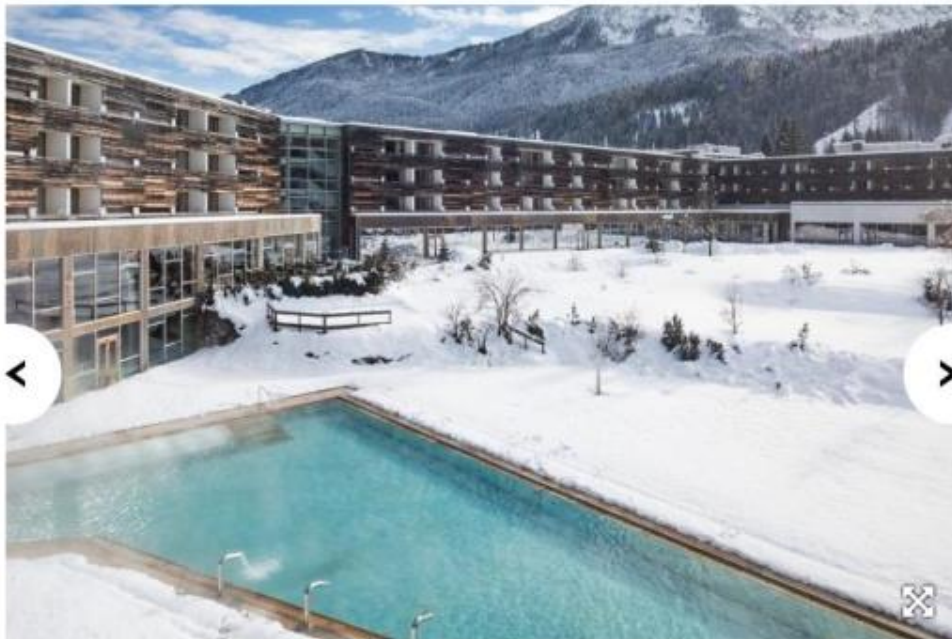
Un bagno all'aperto in acqua calda e fumante, a due passi dalle piste di Nassfeld, celebre località sciistica austriaca, Falkensteiner Carinzia Hotel & Spa offre una piscina riscaldata che fa parte della grande Spa Acquapura, 2.400 mq. di benessere e relax. www.falkensteiner.com