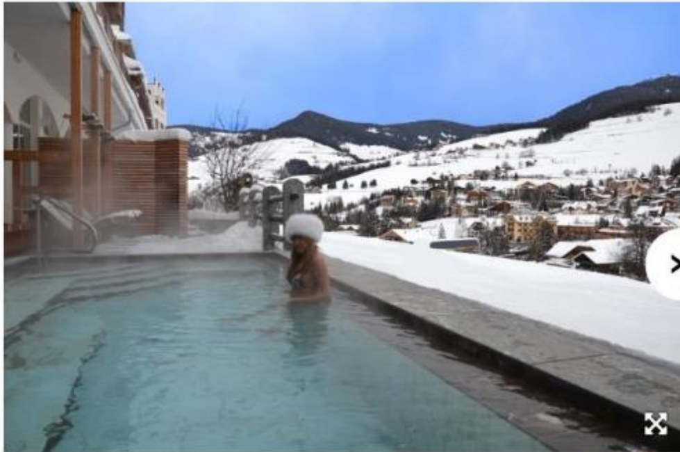
Una piscina panoramica sul tetto per ammirare le Dolomiti. A San Vigilio di Marebbe (Bolzano) Excelsior Dolomites Life Resort offre questa suggestione unica. https://www.myexcelsior.com/