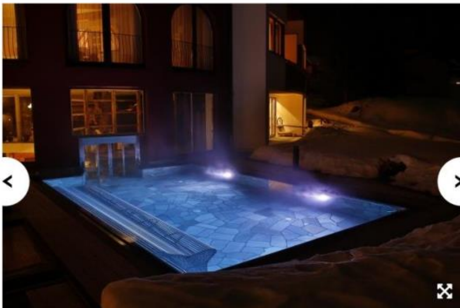
Immersi a 36 gradi con giochi di vapore e cromoterapia alle pendici del comprensorio sciistico Tre Cime di Lavaredo per vivere intensi momenti di relax e benessere nella piscina esterna del Romantik Hotel Santer di Dobbiaco (Bolzano) www.romantikhoteles.com