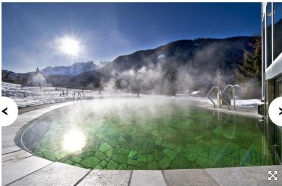
In val d'Ega, tra i riflessi del monte Latemar, a pochi passi dal comprensorio sciistico di Carezza, un suggestivo bagno nella piscina esterna a 30° del Romantik Hotel Post Cavallino Bianco di Nova Levante (Bolzano). www.romantikhotels.com