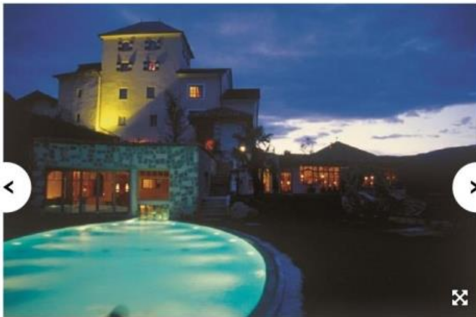
L'inconfondibile sagoma aguzza del massiccio dello Sciliar troneggia sulla Black Pool, piscina esterna riscaldata a 30°, dell'Hotel Turm di Fié allo Sciliar (Bolzano). www.romantikhoteles.com