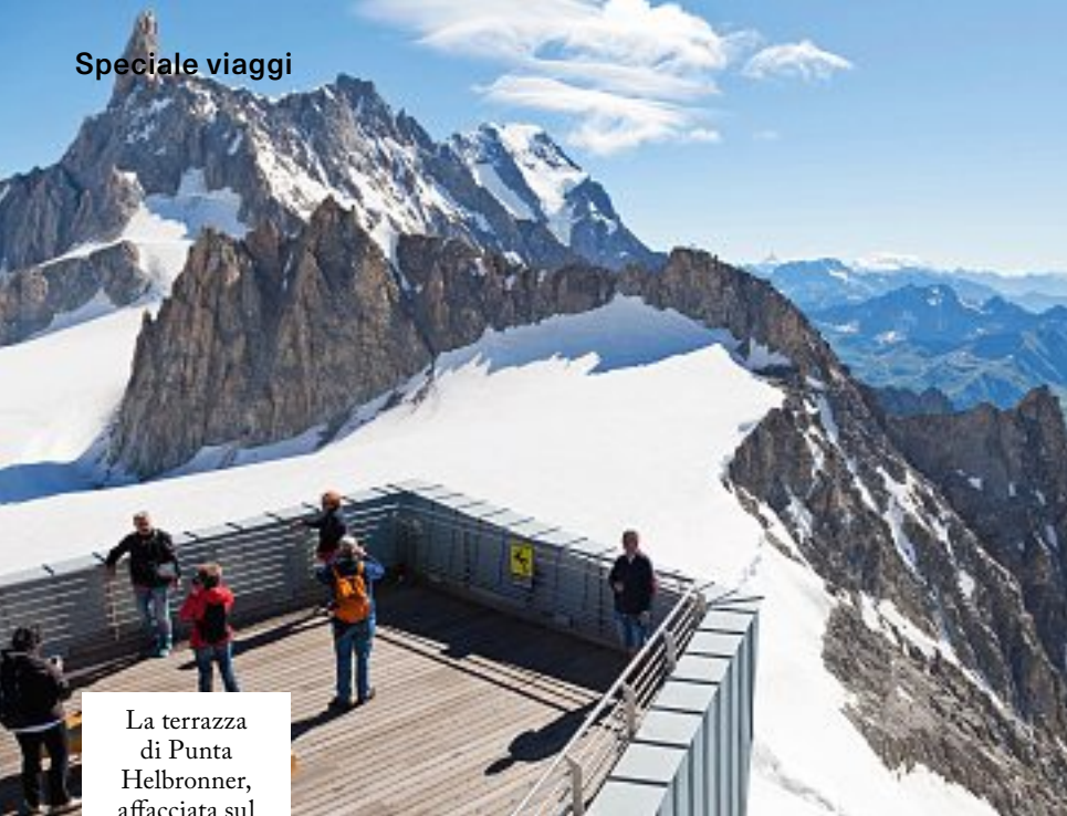
La terrazza di Punta Helbronner, affacciata sul Monte Bianco.

SEGUITO raggiunge in funivia una terrazza circolare che regala una vista a 360 gradi sul Monte Bianco, il Dente del Gigante, le Grandes Jorasses gli altri 4000 valdostani. Un panorama unico delle Alpi italiane, francesi e svizzere. E per i piaceri del palato, il Courmayeur Food Market, tutti i martedì dal 23 luglio al 20 agosto, per gustare prelibatezze tradizionali.