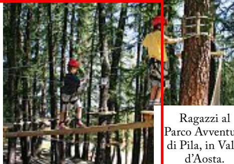
Ragazzi al Parco Avventura di Pila, in Valle d'Aosta.

Un tempo i contadini di montagna, i pellegrini e i contrabbandieri lo utilizzavano per spostarsi da una valle all'altra. È il Sentiero delle due valli (Anterselva e Defereggental): 7 tappe per un totale di 90 chilometri che si snodano tra le montagne e il fondovalle. Anche il Parco Nazionale dello Stelvio è l'ideale per