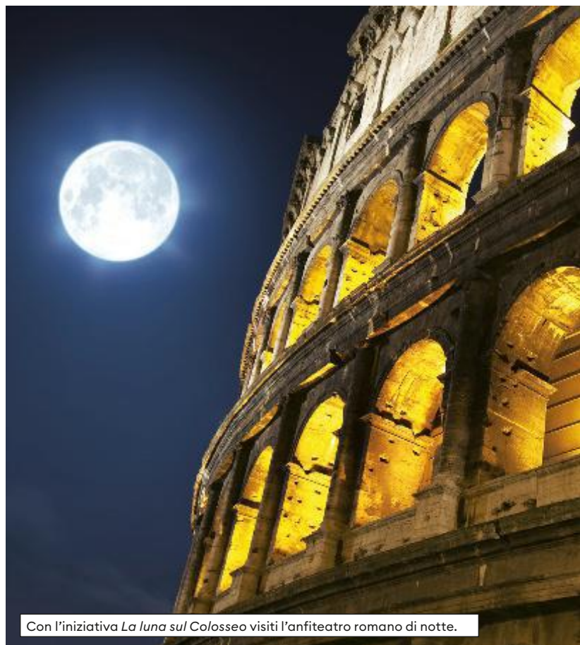
Con l'iniziativa La luna sul Colosseo visiti l'anfiteatro romano di notte.

I sotterranei dove gladiatori e animali attendevano il momento di fronteggiarsi sull'arena, le arcate e gli ordini illuminati dalla luce della luna, la vista