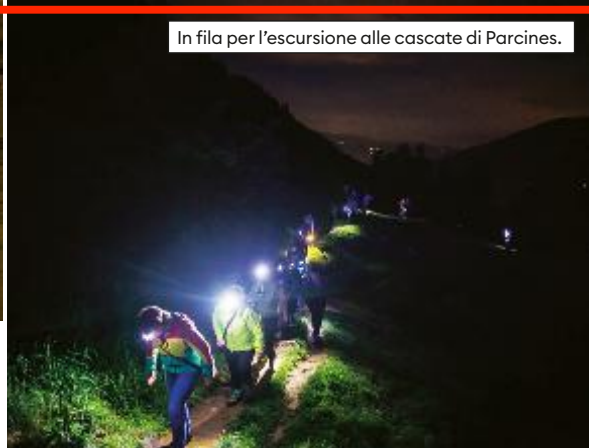
In fila per l'escursione alle cascate di Parcines.