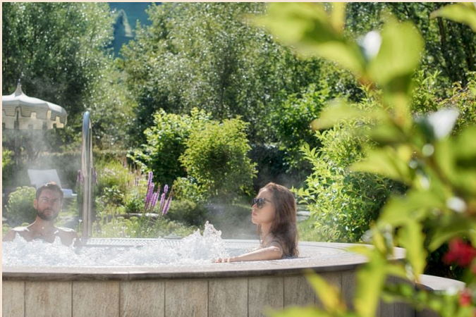
Vasca idromassaggio all'aperto all'Alpenpalace